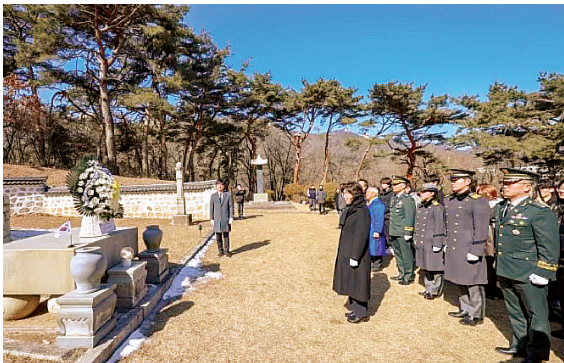
강정에 보훈부 장관이 2월24일 캠페인 동참 차원에서 서울 수유 국가관리묘역의 손병희 선생 묘소를 찾아 참배했다.

국가보훈부는 2월24일부터 28일까지 광복 80주년 올해 3·1절을 앞두고 국민이 함께 전국의 독립유공자 묘소를 참배하는 행사를 열었다.